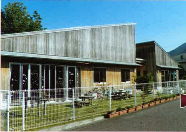
多可町 みなみ児童館