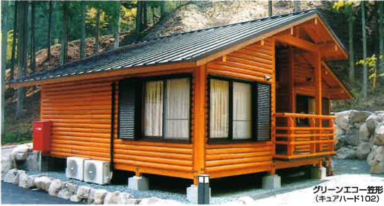
グリーンエコー笠形 (キュアハード102)