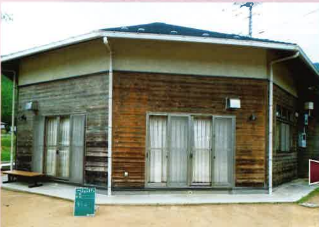
多可町 杉っ子会館